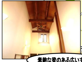
素敵な梁のある広い玄関