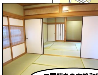
二間続きの本格和室