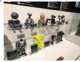
ロボットの進化はすごいです。