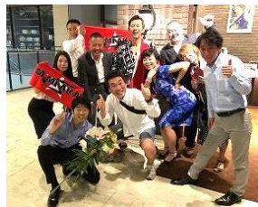
プラスワン応援団