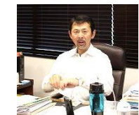
社長の仕事風景。オンオフの切り替えが半端ない！