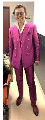
プラスワン応援団